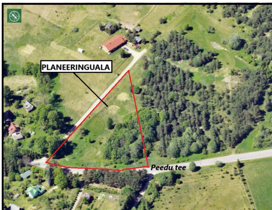
Allikas: maaameti fotoladu (mai 2024.a)